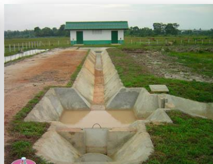
สถานีสูบน้ำ