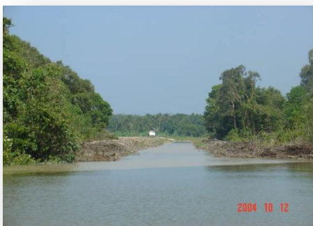
คลองชักน้ำ