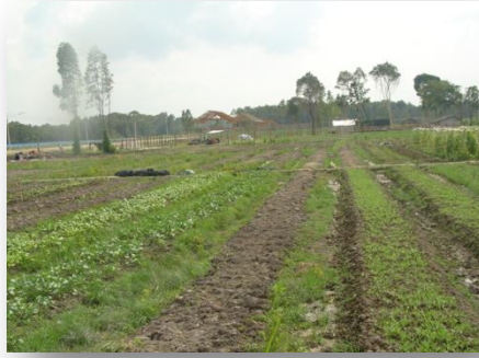
แปลงพืชผัก